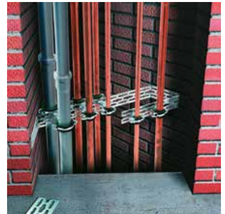
Montage en colonne : Pour la fixation de tuyauteries parallèles, montage avec tiges filetées coupées M8 ou M10