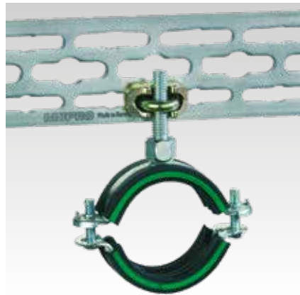
Fixation et réglage aisé des siphons