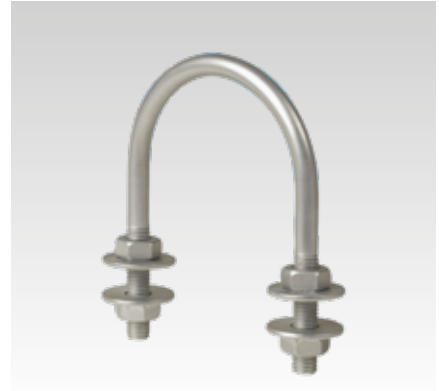
De M8 à M12 avec écrous et rondelles