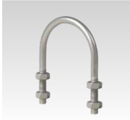
De M16 à M20 avec écrous