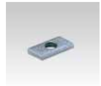
Dimensions de 27/18 à 28/30