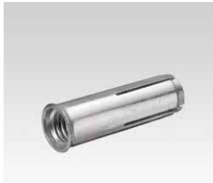
Cheville mécanique avec collerette