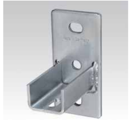
Platine U MPC, soudure longitudinale