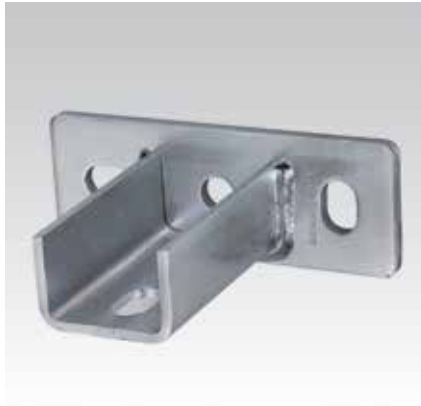
Platine U MPC, soudure transversale