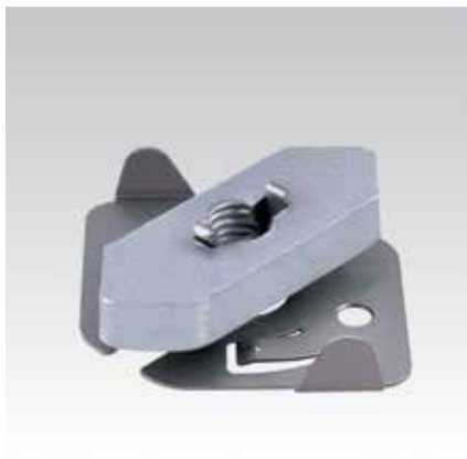
Pour montage d'angle