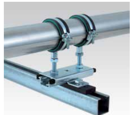
Combinaison d'une glissière plastique et du curseur à glissière sur un rail d'installation MPC