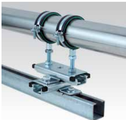
Combinaison de deux curseurs à glissière sur un rail d'installation MPC, sens longitudinal, pour le guidage bilatéral de la dilatation