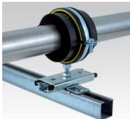
Montage d'un collier coquille sur un rail d'installation MPC