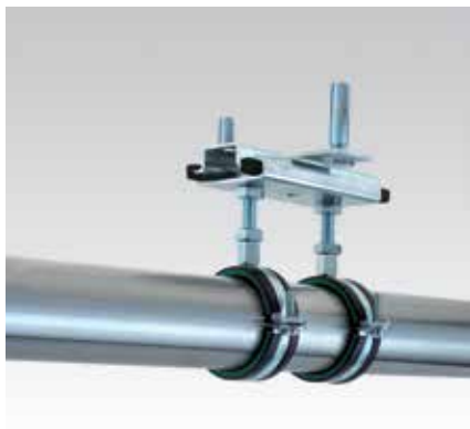
Montage au plafond avec chevilles mécaniques M8