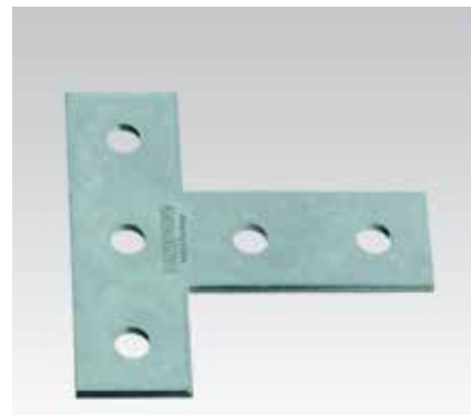
Equerre plate en T