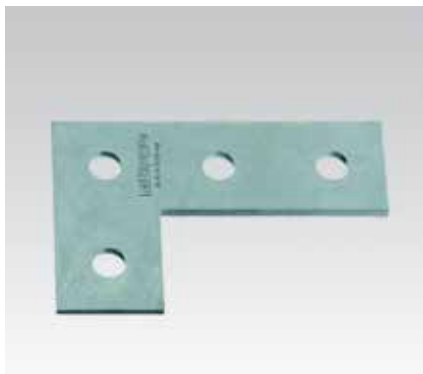
Equerre plate en L