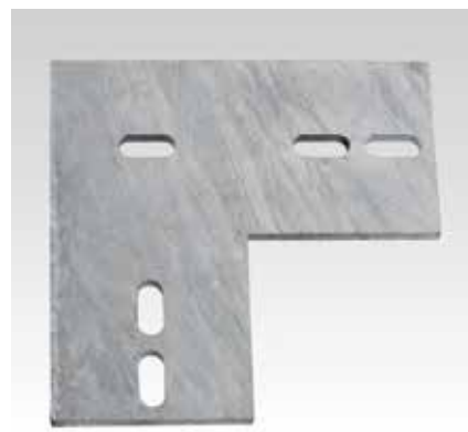
Equerre plate en L