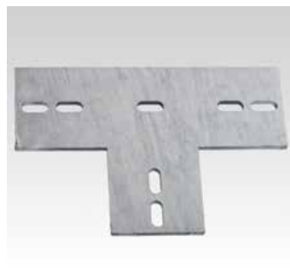
Equerre plate en T